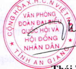
Thái Thúy Châu